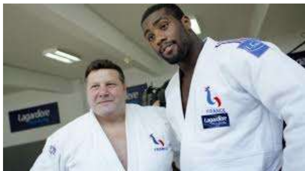
Figure 1 : Angelo Parisi

La 1 ère Edition de l' International Judo Veteran du 15 Octobre 2017 a été parrainée par le Champion Olympique Angelo Parisi .