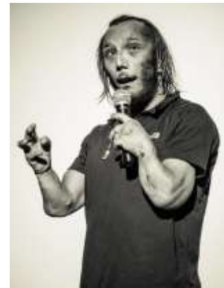
Figure 5 : Philippe Ribière

L'édition 2021 est également marquée par le parrainage de 2 autres personnalités, que sont Adda Abdelli, (cocréateur et coscénariste de la série « Vestiaires ») , paralysé depuis l'enfance à cause d'une polio ; et Philippe Ribière, grimpeur né avec malformation congénitale, photographe, et connu pour avoir créé la catégorie paralympique d'escalade.